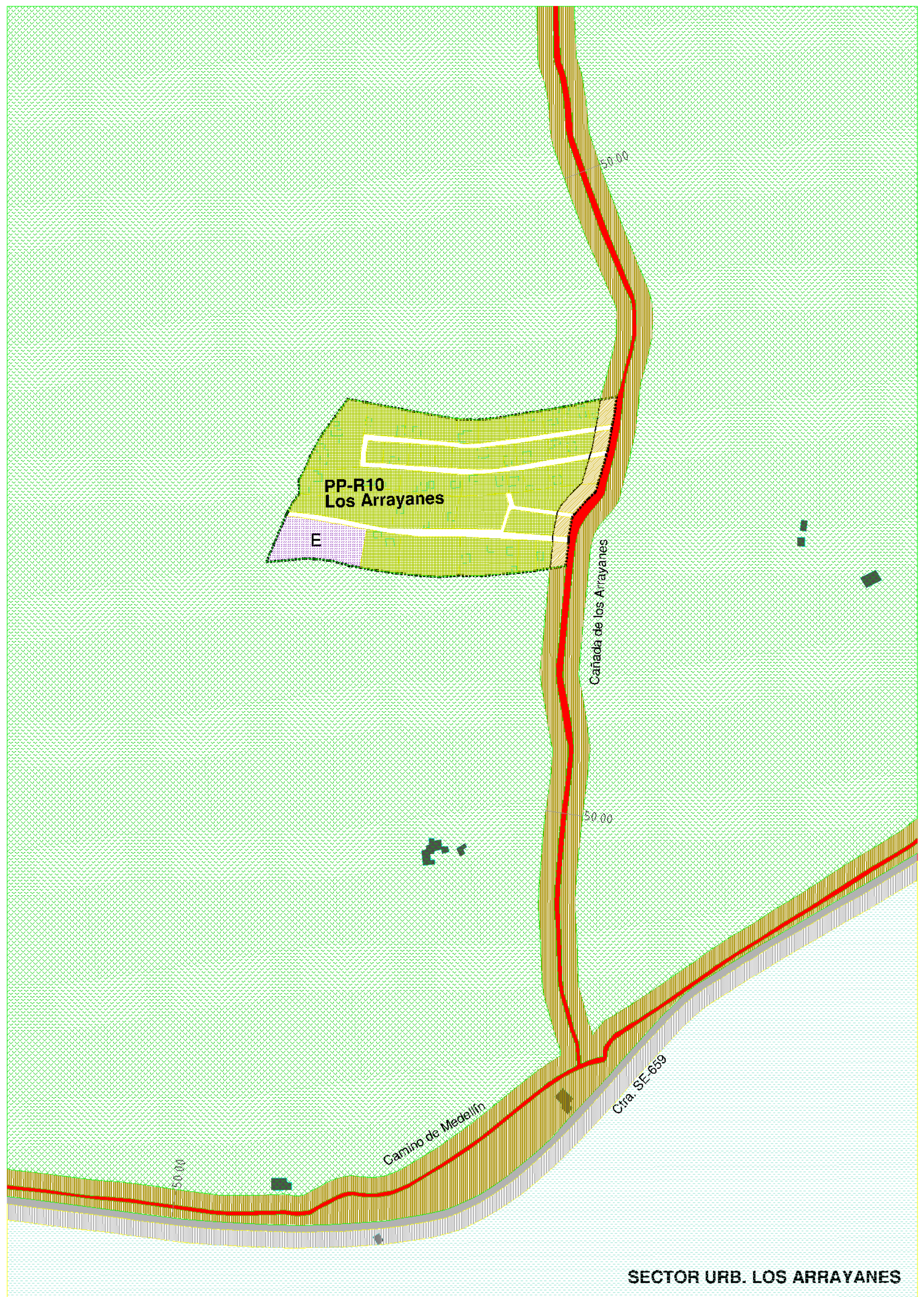
SECTOR URB. LOS ARRAYANES